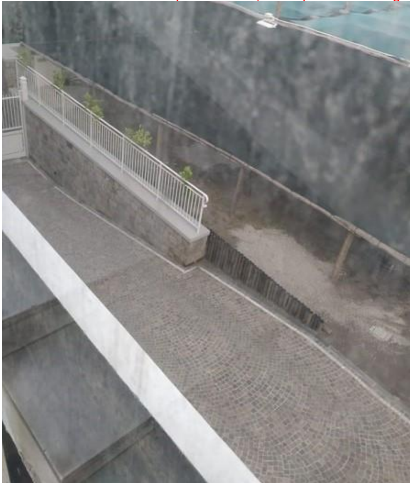
Il viale pavimentato - si nota la ghiaia sul terreno a dx. (12 giu.2020)