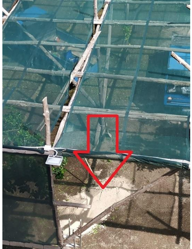
Nelle foto si evidenzia la stesura di ghiaia al suolo il 12 giugno 2020 e i vasti spazi tra gli alberi