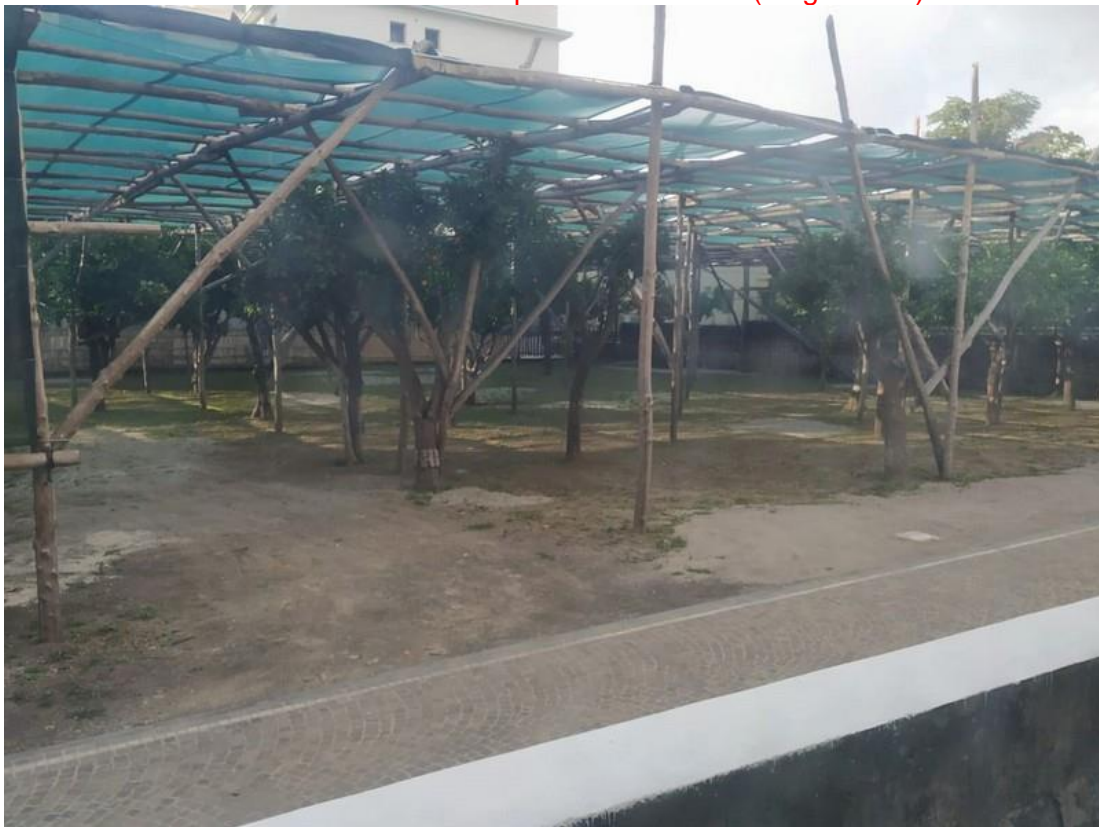
Ecco come si presenta il giardino oggi: agrumeto sorrentino o futuro parcheggio?