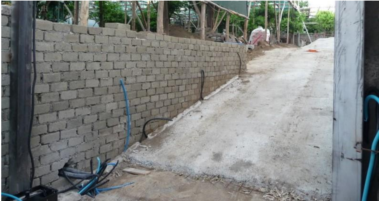
Il muro di contenimento e la rampa carrabile (foto esposto WWF lug. 2019)