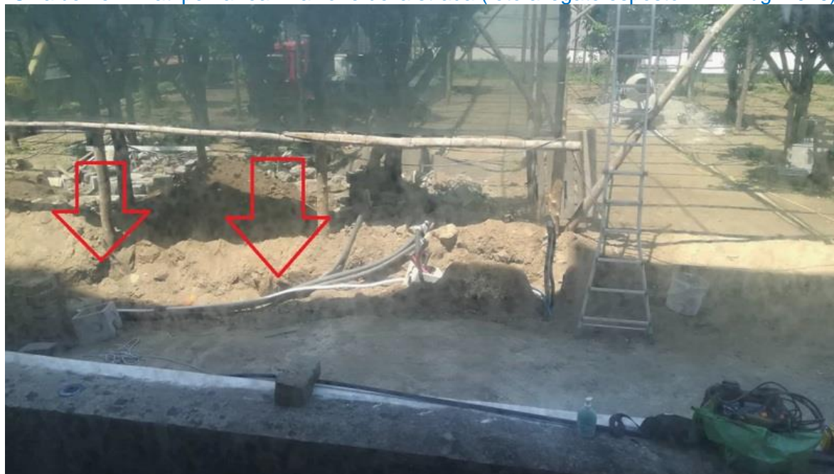
Gli scavi per l'estirpazione degli alberi (esposto WWF lug.2019)