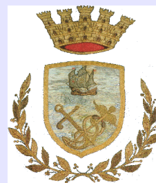
Comune di Meta