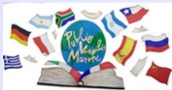
Liceo Publio Virgilio Marone